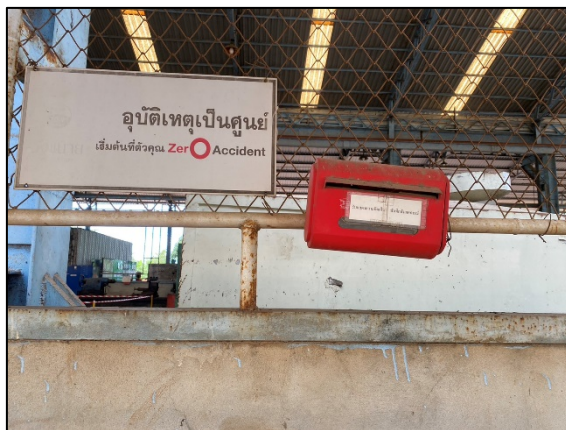
ภาพที่ 2.2-46 ตู้รับฟังความคิดเห็น