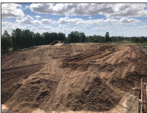
ภาพที่ 2.2-41 ลานกองกากอ้อย