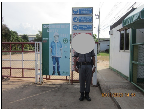
ภาพที่ 2.2-12 เจ้าหน้าที่ตรวจสอบและควบคุม สภาพรถบรรทุกอ้อย