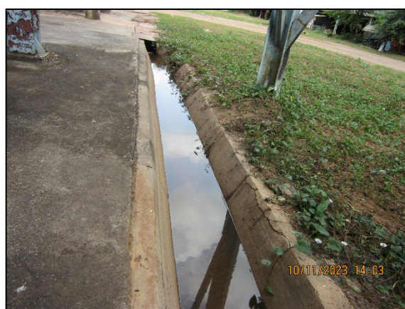
ภาพที่ 2.2-17 รางรวบรวมน้ำฝน