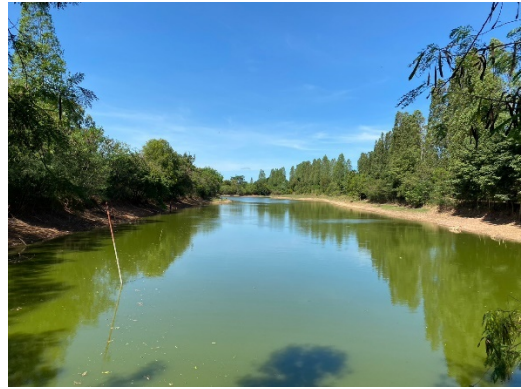
ภาพที่ 2.2-20 ระบบบำบัดน้ำเสีย