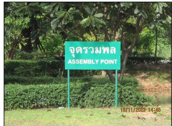
ภาพที่ 2.2-49 อุปกรณ์ป้องกันและระงับอัคคีภัย