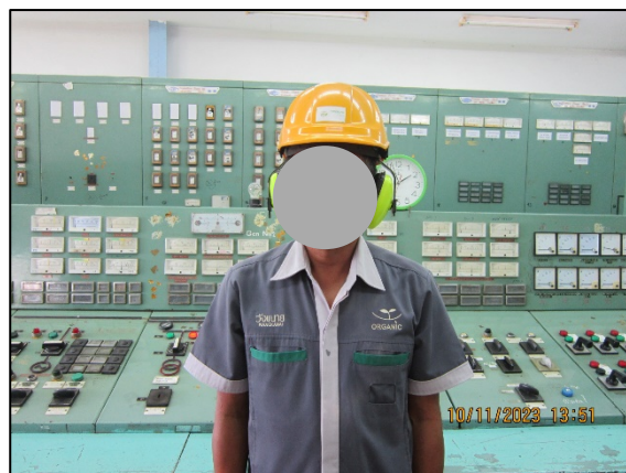
ภาพที่ 2.2-26 พนักงานสวมใส่ Ear Muff