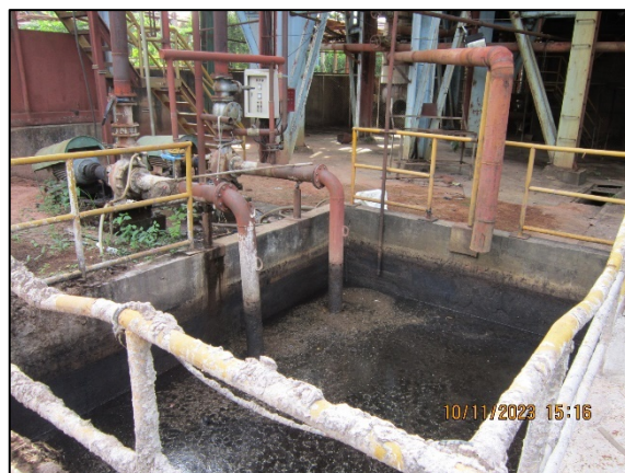
ภาพที่ 2.2-19 รางและบ่อรวบรวมน้ำทิ้งจากระบบ