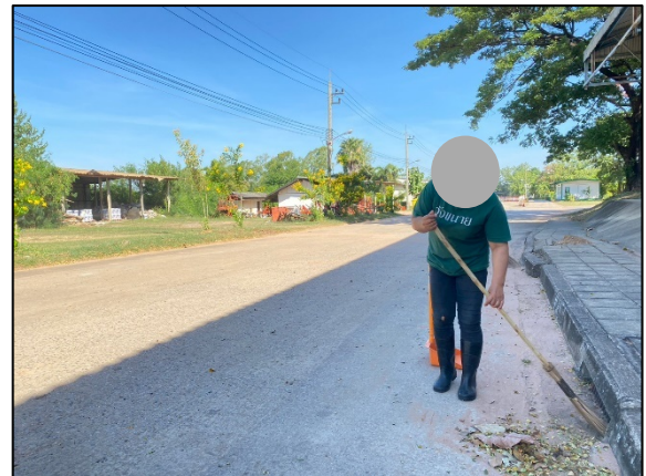
ภาพที่ 2.2-8 พนักงานทำความสะอาดของโครงการ