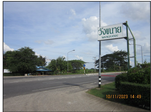
ภาพที่ 2.2-34 พื้นที่ไหล่ทาง