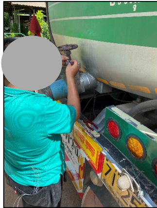
ภาพที่ 2.2-38 เจ้าหน้าที่ลงพื้นที่ตรวจสอบรถบรรทุก