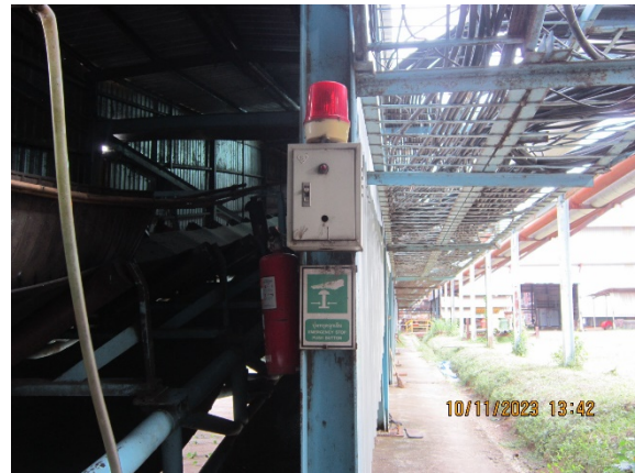
ภาพที่ 2.2-47 ระบบสัญญาณเตือนภัยแบบอัตโนมัติ