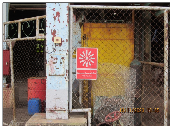
ภาพที่ 2.2-48 ป้ายเตือนอันตรายต่างๆ