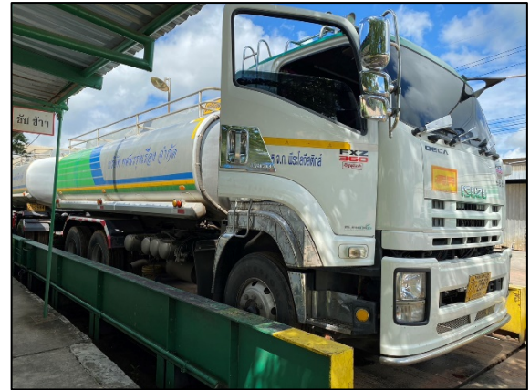
ภาพที่ 2.2-39 รถบรรทุกกาน้ำตาลประเภท Tank Truck