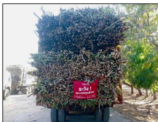
ภาพที่ 2.2-32 ป้ายเตือนส่วนที่บรรทุกเกินตัวรถ