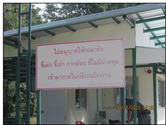
ภาพที่ 2.2-37 ป้ายเตือนให้รถบรรทุกขนส่งซีเค้กและ กากตะกอนหม้อกรองปิดคลุมรถ