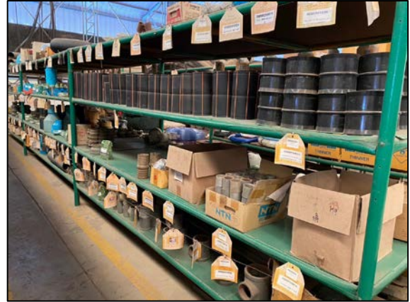
ภาพที่ 2.2-2 อุปกรณ์และอะไหล่สำรอง