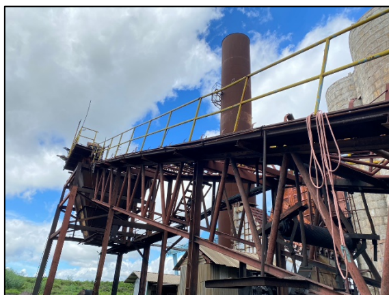
ภาพที่ 2.2-14 ระบบสายพานลำเลียงขี้เถ้า