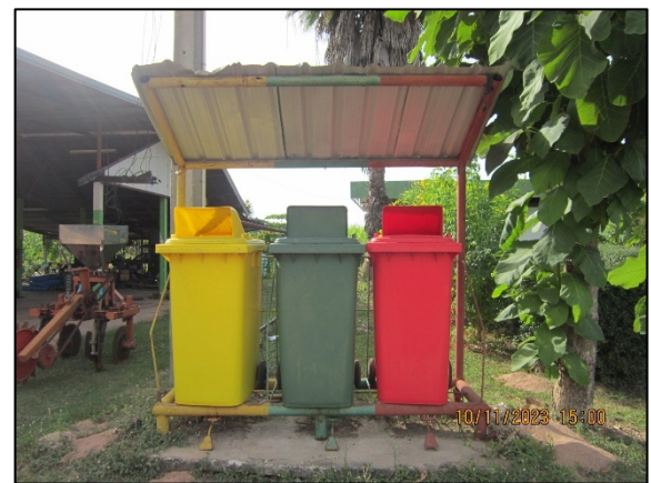
ภาพที่ 2.2-40 ถังขยะแยกประเภท