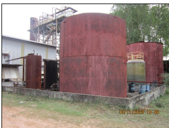
ภาพที่ 2.2-16 คันคอนกรีตล้อมรอบลานถ้ำน้ำมันเตา