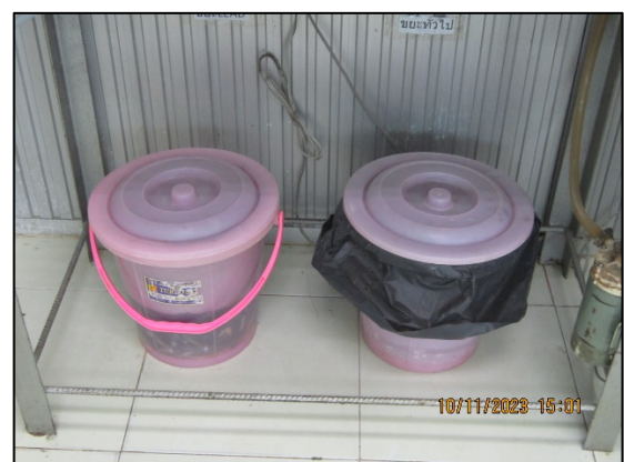
ภาพที่ 2.2-43 ถังใส่กระดาษกรองปนเปื้อนสารตะกั่ว ในห้องปฏิบัติการ