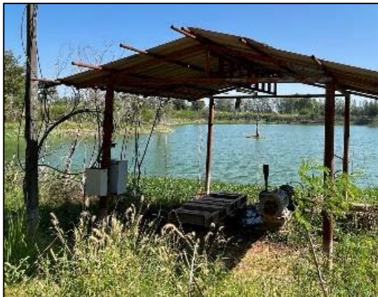
ภาพที่ 2.2-23 จุดสูบน้ำสำหรับแจกจ่ายให้เกษตรกร