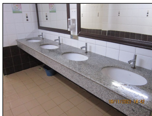
ภาพที่ 2.2-51 ห้องสุขา