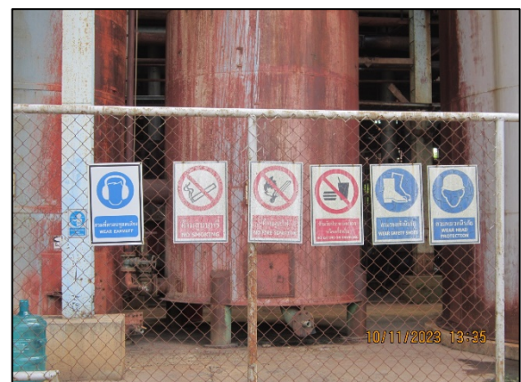
ภาพที่ 2.2-25 ป้ายเตือนให้สวมใส่อุปกรณ์คุ้มครองความปลอดภัยส่วนบุคคล