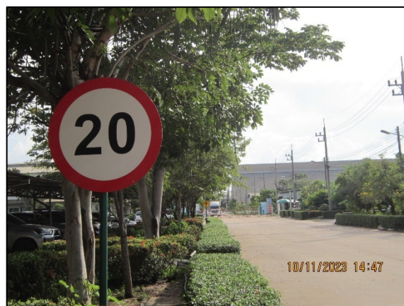
ภาพที่ 2.2-28 ป้ายจำกัดความเร็วภายในโครงการ