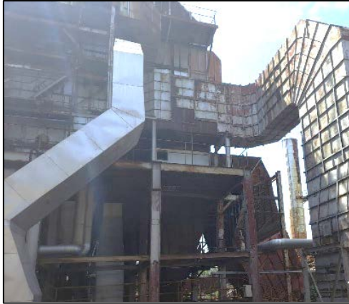
ภาพที่ 2.2-1 ระบบดักฝุ่นแบบมัลติไซโคลน