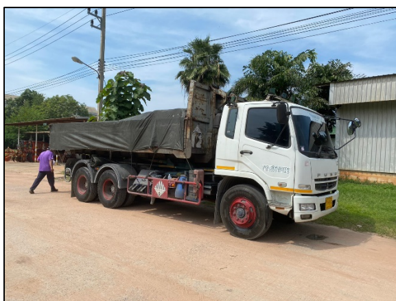
ภาพที่ 2.2-36 ผ้าใบปิดคลุมรถ