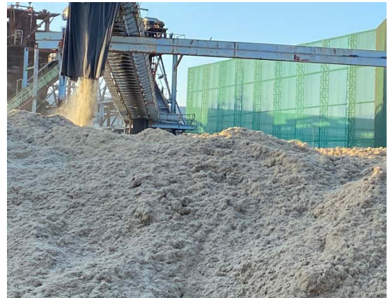
ภาพที่ 2.2-5 ถูผ้าใบบริเวณปลายสายพานลำเลียง