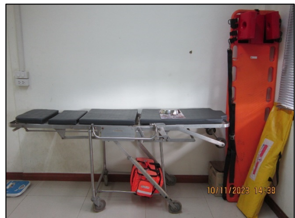
ภาพที่ 2.2-52 อุปกรณ์ปฐมพยาบาลและเจ้าหน้าที่ประจำห้องพยาบาล