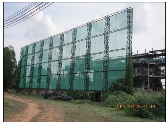
ภาพที่ 2.2-6 แนวกำแพง