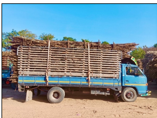
ภาพที่ 2.2-31 สายรัดป้องกันอ้อยหกหล่น