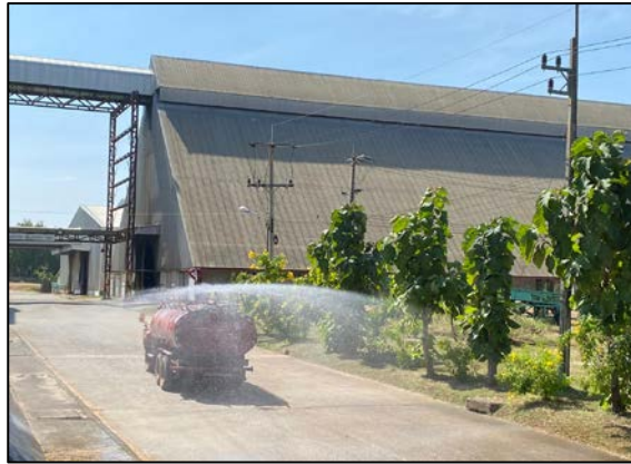
ภาพที่ 2.2-4 รถฉีดพรมน้ำ