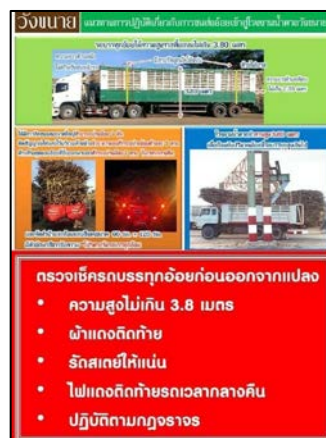
ภาพที่ 2.2-30 ป้ายประชาสัมพันธ์ขั้นตอนปฏิบัติ ในการจอดรถบรรทุกอ้อย