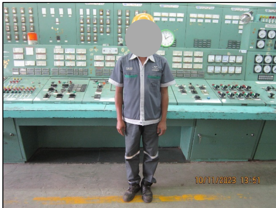
ภาพที่ 2.2-7 พนักงานสวมใส่ PPE