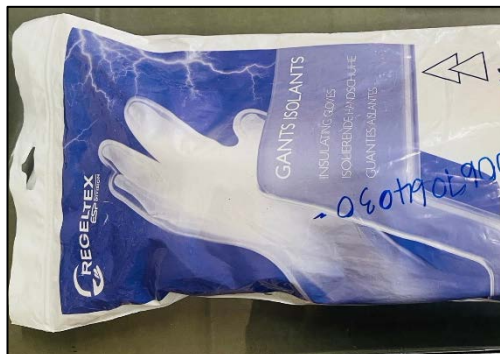
ภาพที่ 2.2-13 PPE สำรอง