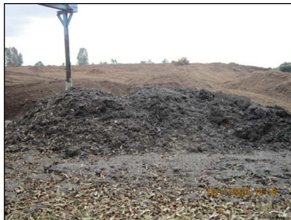
ภาพที่ 2.2-13 พื้นที่ลานกองขี้เถ้า