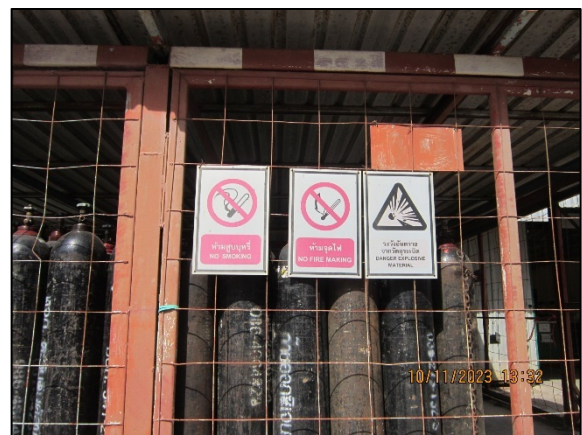
ภาพที่ 2.2-56 ป้ายเตือนห้ามก่อประกายไฟ