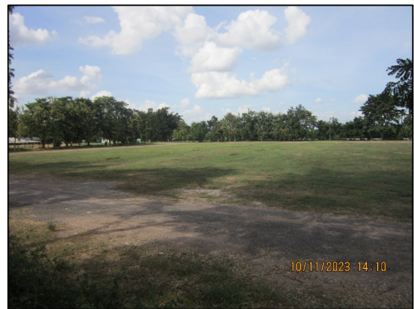
ภาพที่ 2.2-35 ลานจอดรถบรรทุกอ้อย