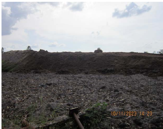
ภาพที่ 2.2-11 ลานกองกากตะกอนหม้อกรอง