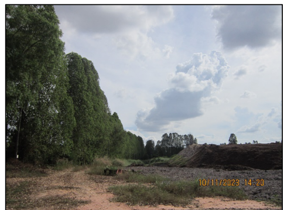
ภาพที่ 2.2-57 พื้นที่สีเขียวของโครงการ