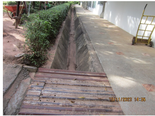
ภาพที่ 2.2-45 รางรวบรวมน้ำฝนรอบพื้นที่โครงการ