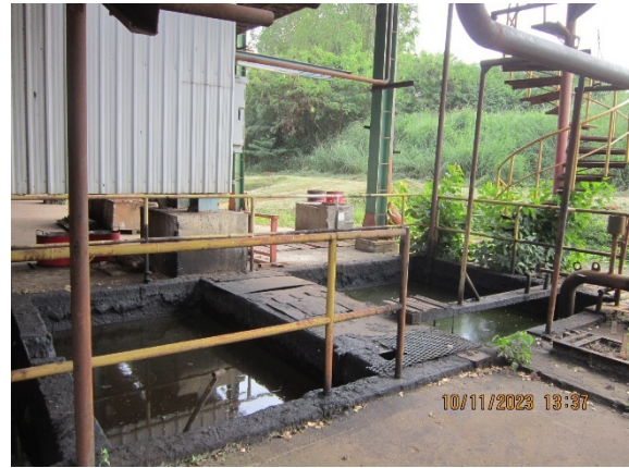
ภาพที่ 2.2-22 บ่อแยกน้ำ-น้ำมัน (Oil Separator)