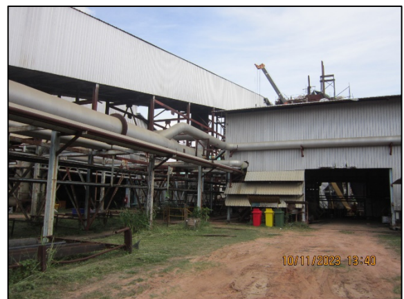
ภาพที่ 2.2-9 ระบบสายพานลำเลียงแบบปิด