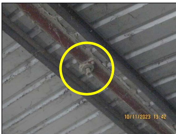
ภาพที่ 2.2-10 หัวฉีดพ่นน้ำแบบสเปรย์ในระบบ สายพาน