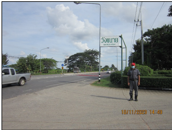
ภาพที่ 2.2-33 เจ้าหน้าที่คอยดูแลและจัดระบบคิวรถ บริเวณด้านหน้าโครงการ