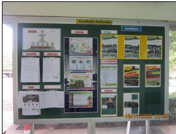
ภาพที่ 2.2-55 บอร์ดประชาสัมพันธ์ข่าวสารและกิจกรรมส่งเสริมความปลอดภัยในการทำงาน