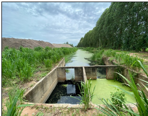
ภาพที่ 2.2-18 บ่อตกตะกอน