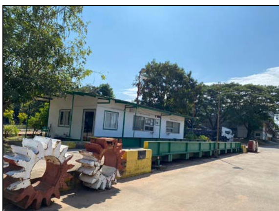
ภาพที่ 2.2-29 อาคารขังน้ำหนักรถบรรทุก