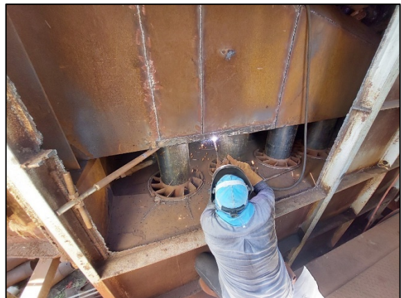
ภาพที่ 2.2-3 การซ่อมบำรุงระบบบำบัดมลพิษทางอากาศ