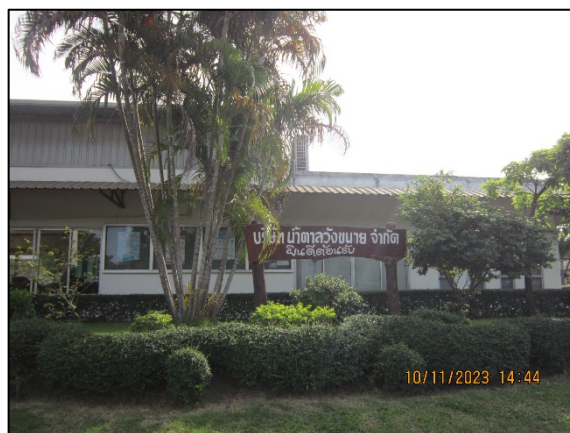
ภาพที่ 2.2-58 พื้นที่สีเขียวของโครงการ (ต่อ)