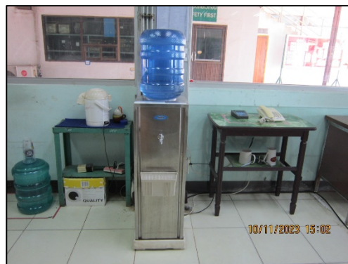
ภาพที่ 2.2-50 ตู้น้ำดื่ม