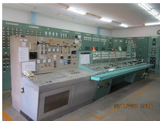
ภาพที่ 2.2-27 Control Room