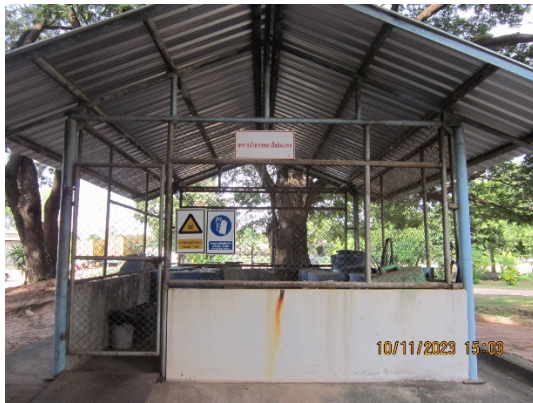
ภาพที่ 2.2-44 อาคารเก็บรวบรวมกากของเสียอันตราย