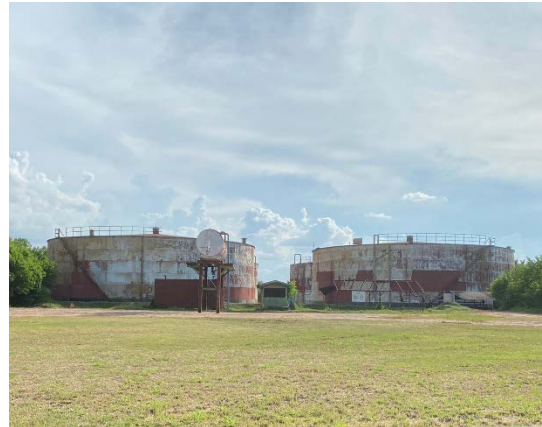
ภาพที่ 2.2-24 ถังเก็บกากน้ำตาล